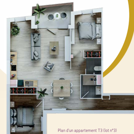
Plan d'un appartement T3 (lot n°3)